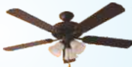
Ventiladores de Teto