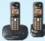
Aparelhos de Telefone