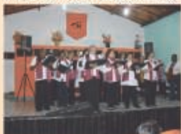
Coral da CK Santo Antonio de Rio Acima